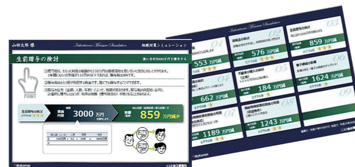
相続対策のご提案（イメージ）

ご加入したその時から、お客様のさまざまなお悩み、不安を解消し、相続発生時はもちろん、 今後の人生に豊かさと安心をご提供いたします。